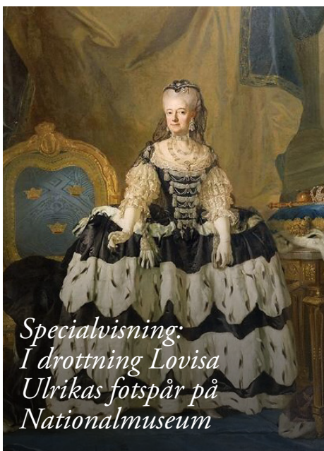
Specialvisning: I drottning Lovisa Ulrikas fotspår på Nationalmuseum

Vänföreningens årsbokslut 2024 kan rekvideras i slutet av april från kansliet dtv@drottningholmsteaternsvanner.se eller på 08-556 931 12