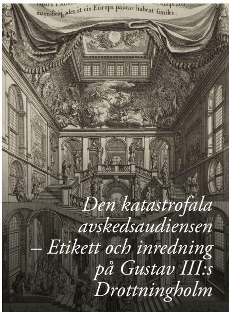
Den katastrofala avskedsaudiensen – Etikett och inredning på Gustav III:s Drottningholm