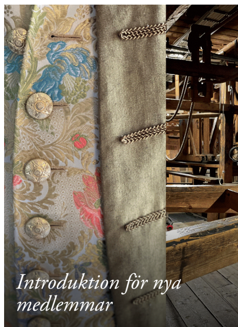
Introduktion för nya medlemmar

Vi vill gärna bjuda dig som under de senaste åren tillkommit som medlem i vår vänförening till en informationskväll där du får veta mer om den vackra teatern, om vänföreningen, om vad det innebär att vara medlem hos oss och för att få träffa medarbetare från teatern.