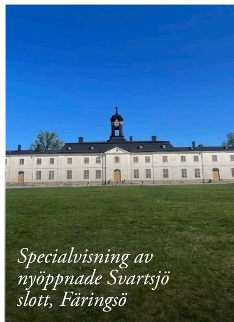
Specialvisning av nyöppnade Svartsjö slott, Färingsö

Visningen är endast för medlemmar. Antalet platser är begränsat.