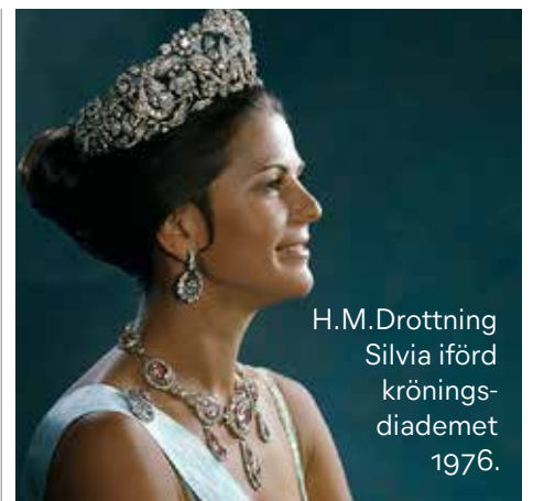
H.M.Drottning Silvia iförd kröningsdiadem 1976.