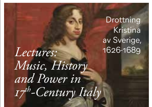
Drottning Kristina av Sverige, 1626-1689