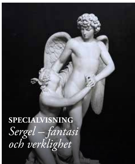
SPECIALVISNING Sergel – fantasi och verklighet

SPECIALVISNING av utställningen Sergel – fantasi och verklighet med Katarina Wendt Englund om Sergels liv och konst i Sverige och internationellt under 1700-talet.