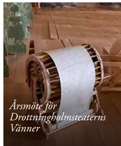
Årsmöte för Drottningholmsteaterns Vänner

ÅRSMÖTE Med föreläsning av kulturansvariga Åsa Tillman om den nyinstallerade scenbelysningen som återskapar 1700-talets fladdrande vaxljus samt en uppdatering om konserveringen av originalkulisserna.