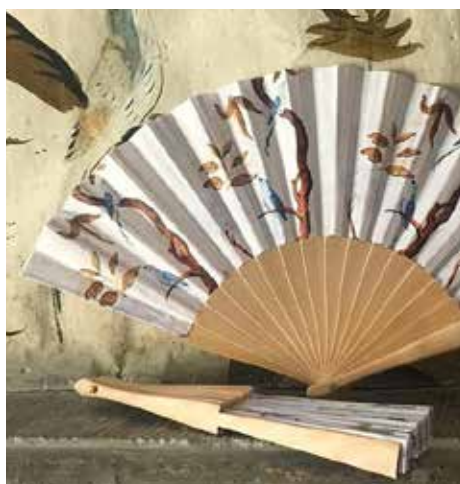
Den här solfjädern och mycket annat återfinns i Teaterboden.

PRIS 160 kr PENSIONÄR 140 kr ANMÄLAN www.drottningholmsteaternsvanner.se/program